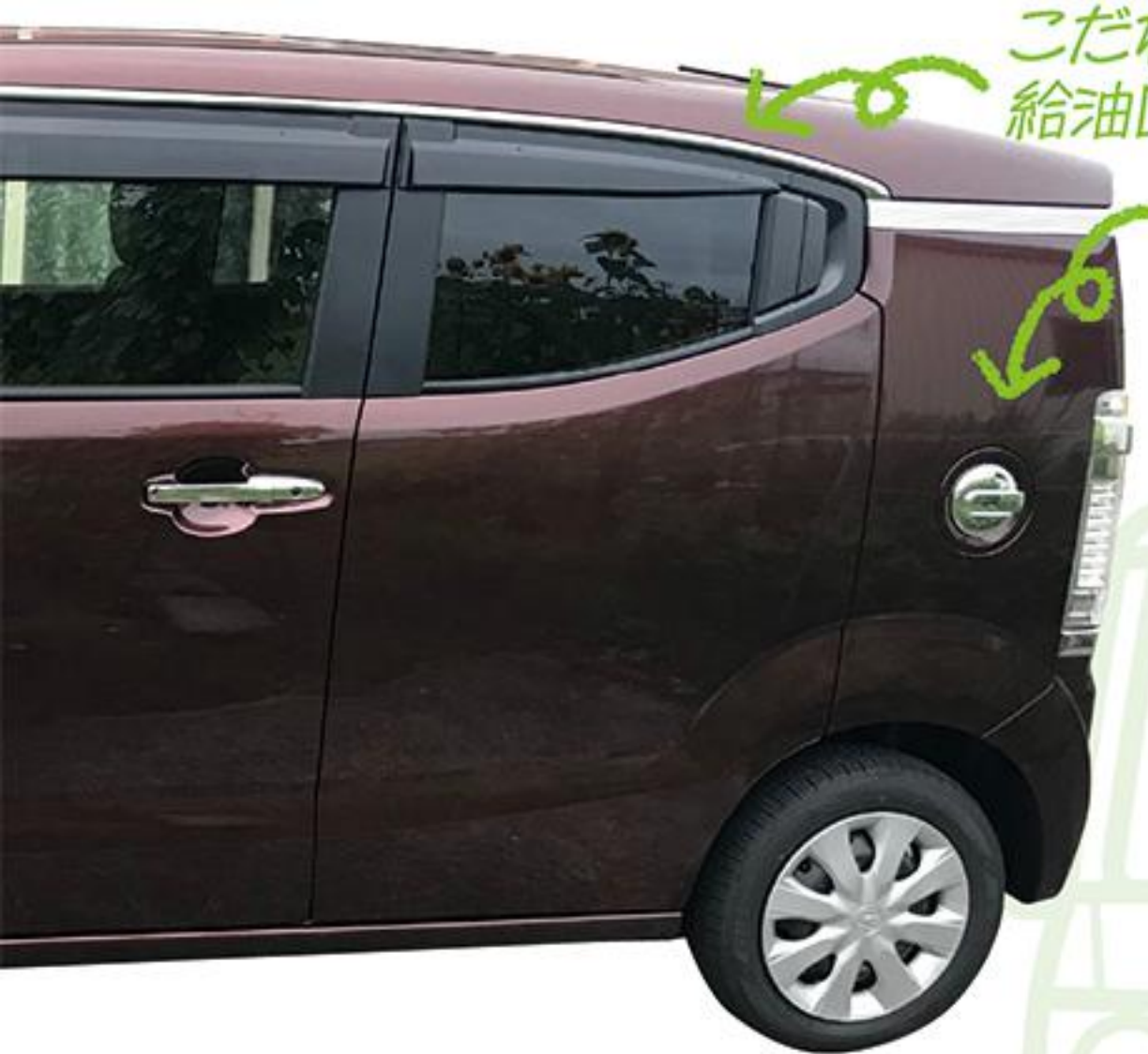
こだわりを感じる給油口とリアドア