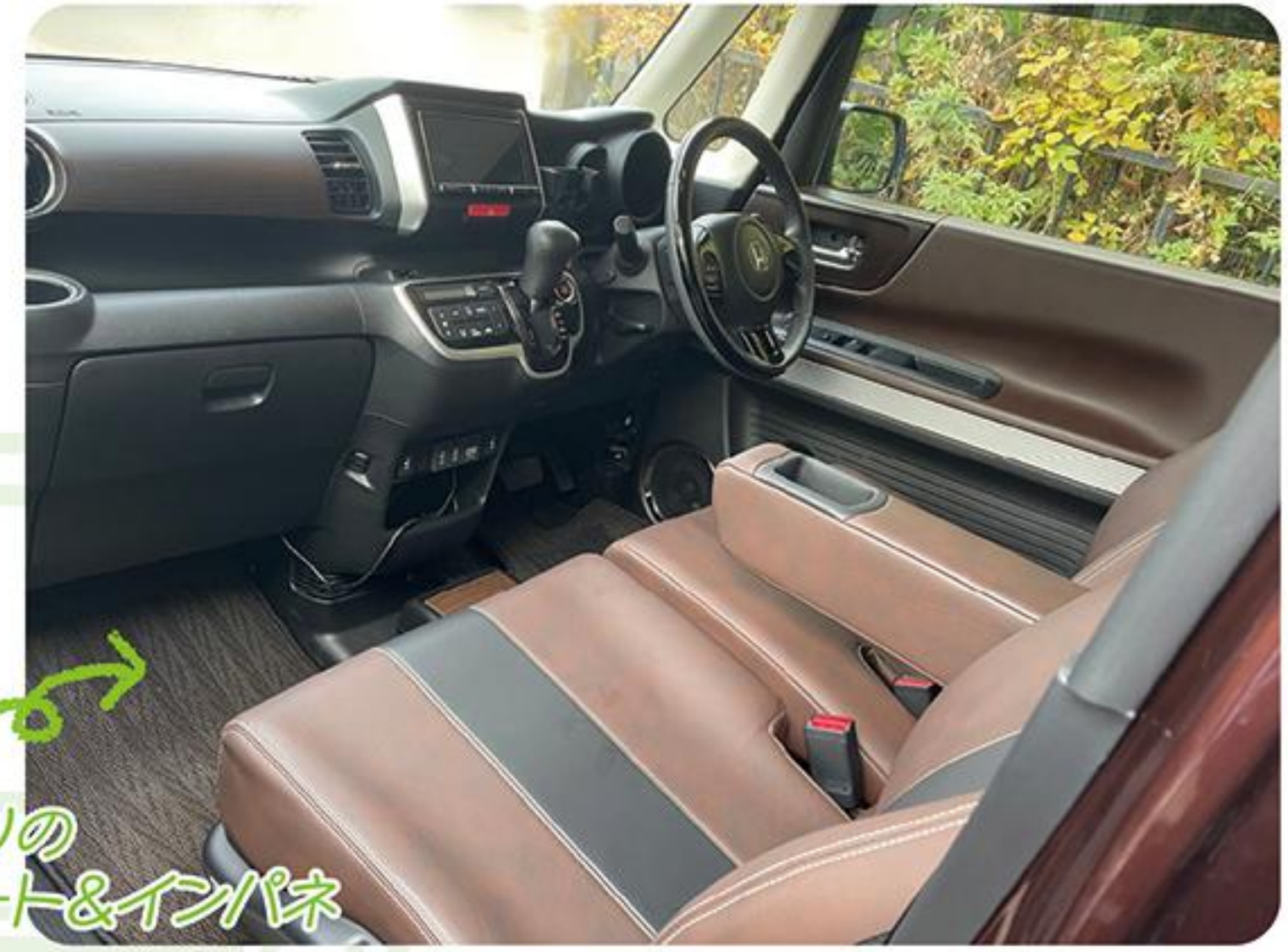
お気に入りのレザーシート&インパネ