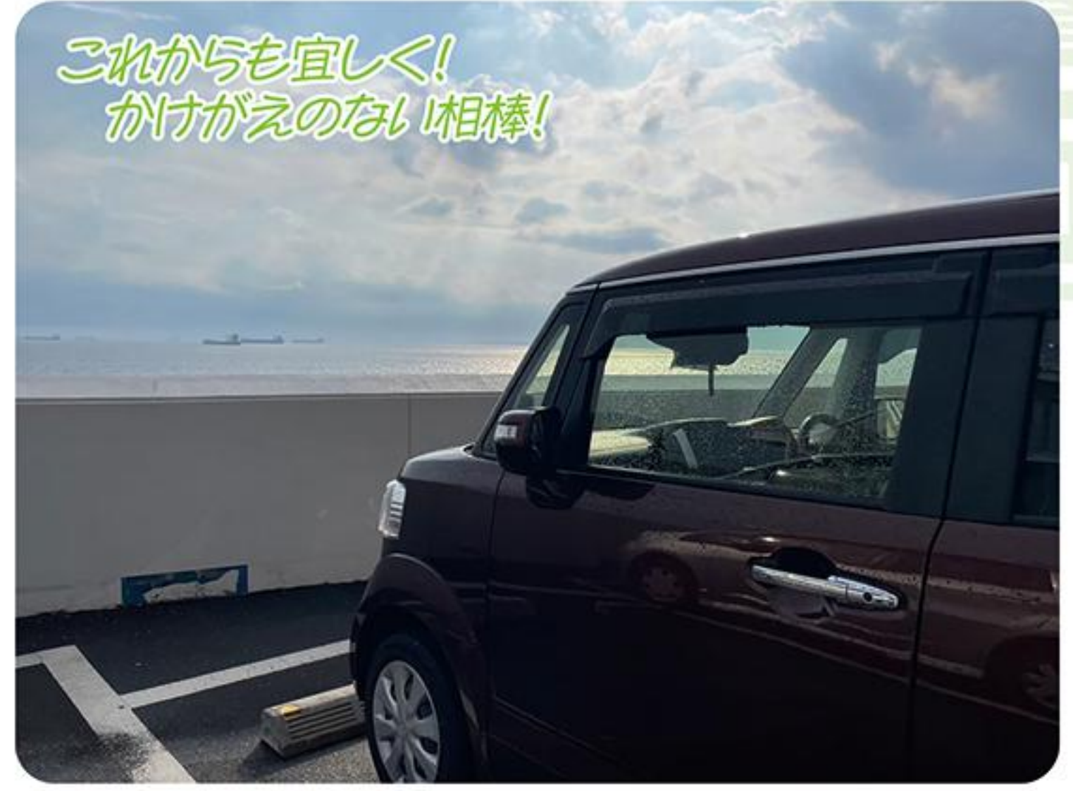
これからも宜しく! かけがえのない相棒!