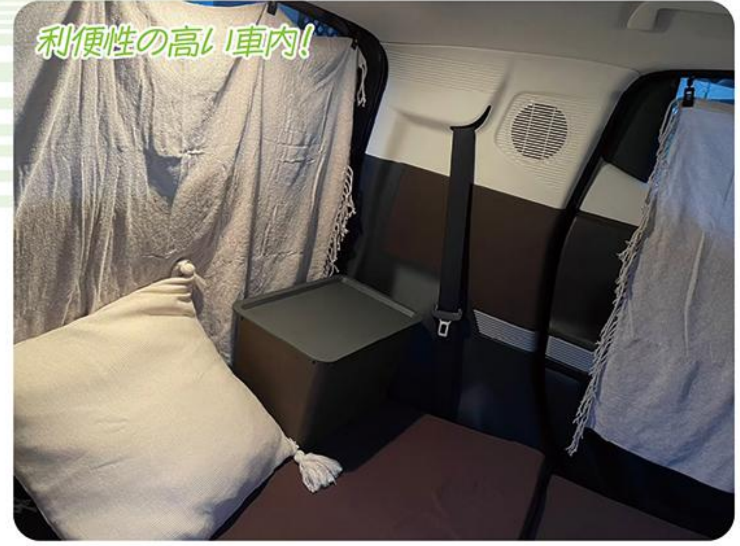
利便性の高い車内!